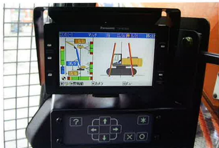
作業状況と重心位置を表示する“ハイリフトモニタ”